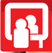
Ayna Buğu Çözücüleri